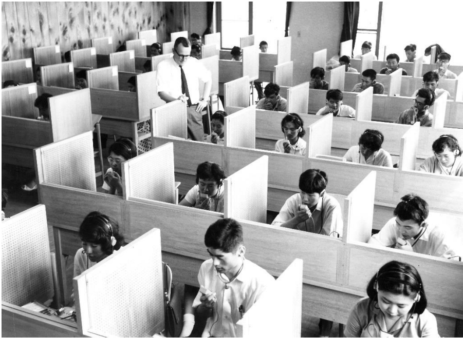
Language Laboratory (1961)

We will show you the photo images of past ICU from our shelves.