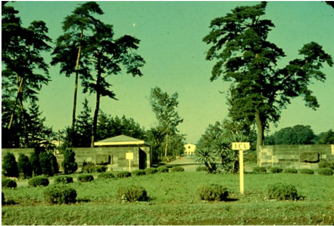
ICU Main Gate (around 1957)

https://www-lib.icu.ac.jp/Archives/Newsletter/img/002.jpg